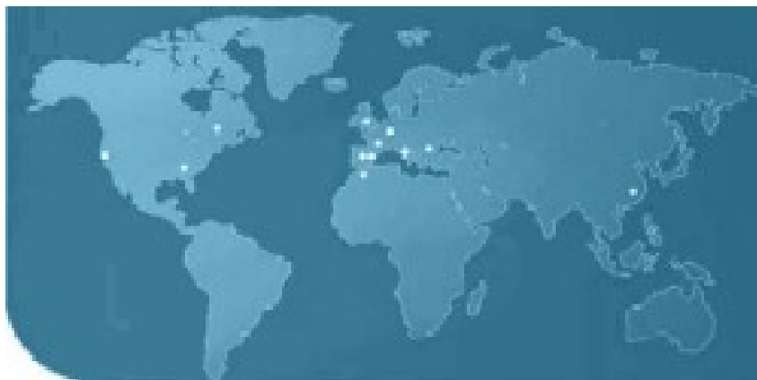
Le sedi degli Studios Ubisoft in tutto il mondo